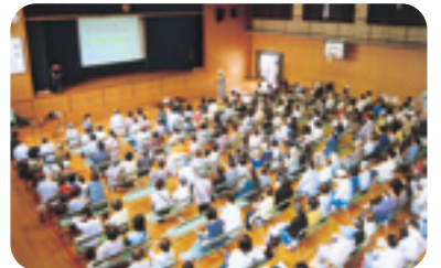
約600名の参加がありました

避難所開設訓練では避難者の受付や待機場所への誘導、運営全般に関する手順の確認や、防犯・防災面からの地域の見回りなどを行いました。又、講堂内での今回の震災に対する大阪市の支援報告などの講話を聴き、防災意識の高揚に努めました。さらに水消火器を使つての消火訓練や炊き出し・配給訓練なども行いました。関西でも地震発生の可能性が指摘されている昨今であり、今後も地域住民の方々々と力をあわせて取り組んでいく予定です。