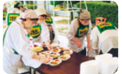
炊き出し班も大忙し