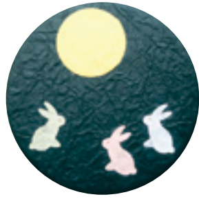
和紙でつくったお月見かざり