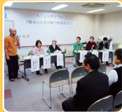
ミニシンポジウム

また、新高地域のボランティアの方々にもご協力いただき、ふれあい喫茶コーナーを設けていただきました。相談の合間に、温かいコーヒーやおいしいぜんざいをいただき、和やかな雰囲気イベントとなりました。