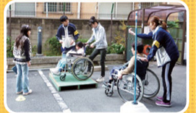
高齢者施設の職員が直接アドバイス