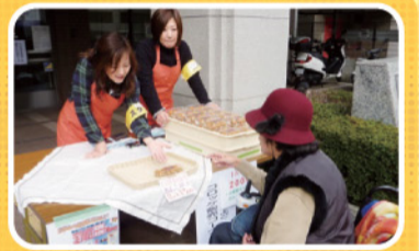
おいしいコロッケどうぞ!