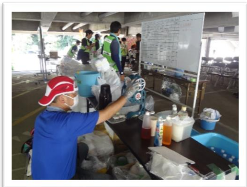
ボランティアにかき水を振る舞う地域住民

今回、私は被災現場へ行くことは少なかったですが、地元の岡山市社会福祉協議会と地域とのつながりを強く感じることはできました。岡山市社協は現地社協として、町内ニーズをとりまとめた地域会長や NPO、ボランティアグループと多様な機関と普段の関わりを活かして連携し、効率よくボランティアのマッチングを行っていました。また、センターに地域住民の方が大量のおしほりを持ってきてくれたり、かき水を振る舞ってくれたり地域住民と社協が一体となって全国のボランティアを受け入れ、センター運営をされていた印象です。派遣職員としては、日頃の地域活動や安否確認、見守り活動の延長に災害支援があることを感じ、いつどこで発生するかはわからない災害に対しての備えを、改めて確認させられた4日間でした。