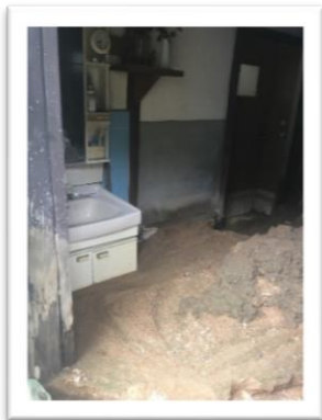
家屋に入り込んだ土砂をかき出す