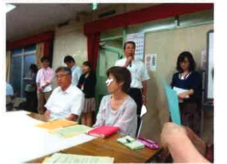
各班の討議結果を次々に発表